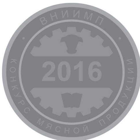
Рис. 2 Серебряная медаль

Заведующий отделом маркетинга ФГБНУ «ВНИИМП им. В.М. Горбатова»