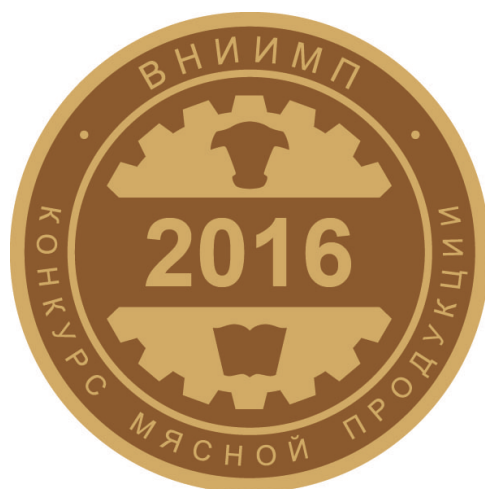
Рис. 1 Золотая медаль

Победитель в номинации «Бренд года» праве при реализации продукции под брендом-победителем использовать обозначения Золотой медали (рис.1), Серебряной медали (рис. 2) и надпись «Бренд года 2016» до 31 декабря 2017 года.