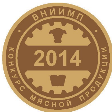
Рис. 1 Золотая медаль

Победитель конкурса «Третий профессиональный конкурс мясной продукции» вправе при реализации продукции использовать обозначения Золотой медали (рис.1), Серебряной медали (рис. 2) и надпись «Продукт года 2014» до 31 декабря 2015 года