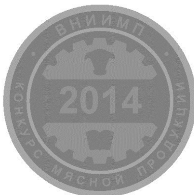
Рис. 2 Серебряная медаль

Заведующий отделом маркетинга ФГБНУ «ВНИИМП им. В.М. Горбатова»