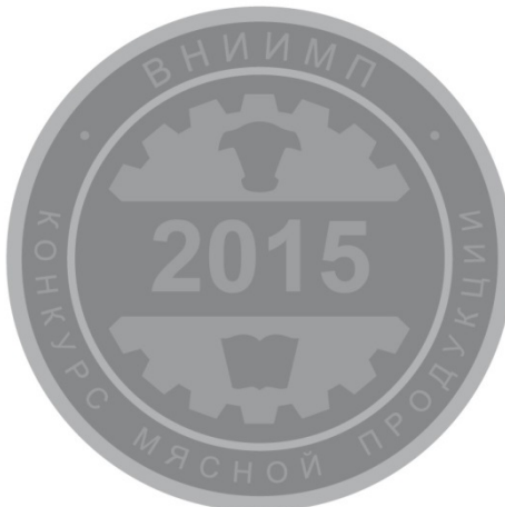
Рис. 2 Серебряная медаль

Заведующий отделом маркетинга ФГБНУ «ВНИИМП им. В.М. Горбатова»