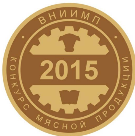
Рис. 1 Золотая медаль

Победитель конкурса «Четвертый профессиональный конкурс мясной продукции» вправе при реализации продукции использовать обозначения Золотой медали (рис.1), Серебряной медали (рис. 2) и надпись «Продукт года 2015» до 31 декабря 2016 года